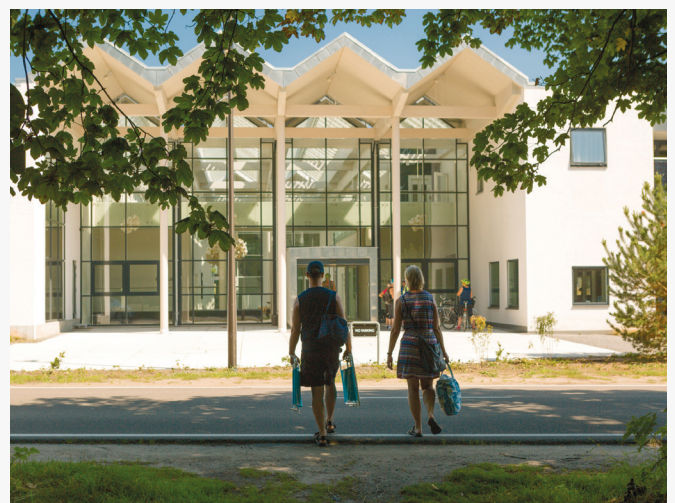
Green Solutions House modtager gæster.

På baggrund af denne viden har man på hotellet hængt plakater op med information om, hvorfor værelserne ser ud, som de gør. Fx står der under titlen Bæredygtighed: "Vi har valgt at beholde de gamle badeværelser. De fungerer perfekt, og vi vil ikke bruge ressourcer på udelukkende at forkæle øjet".